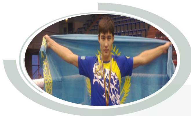
Чемпион мира по МУАЙ-ТАЙ